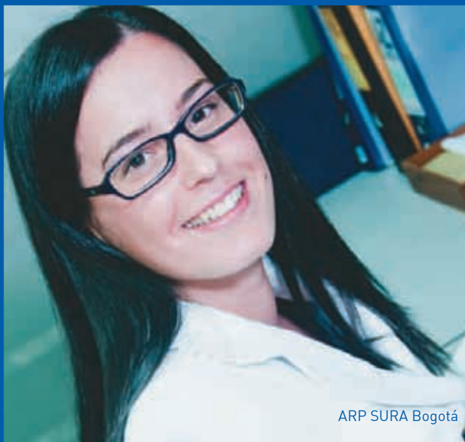
ARP SURA Bogotá

del total de los empleados, tienen entre 26 y 45 años de edad, lo que nos hace una Compañía joven.