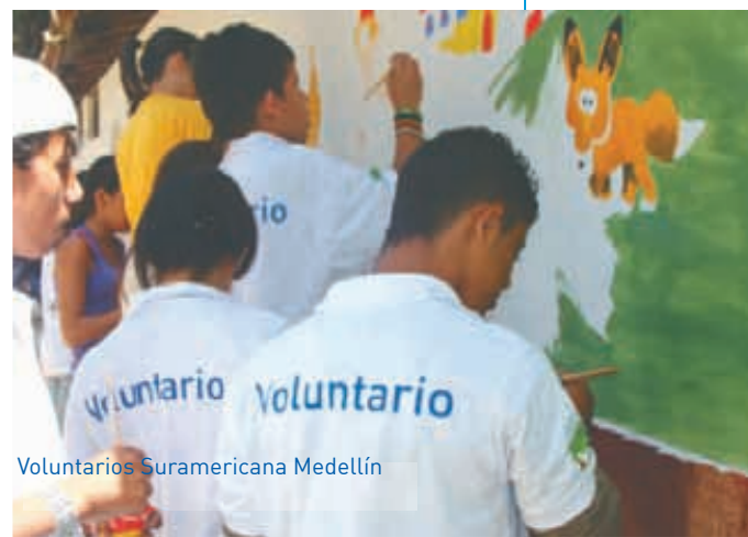
Voluntarios Suramericana Medellín

por la ola invernal del último trimestre de 2010 en Colombia con $181 millones. Por cada peso la Fundación Suramericana aportó $2 pesos adicionales, para un total de $562 millones.