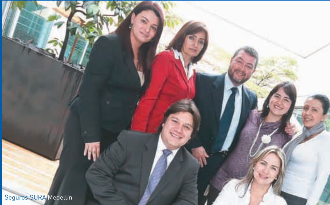
Seguros SURA Medellín